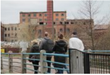
• Spacery badawcze