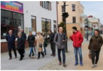
• Spacery badawcze