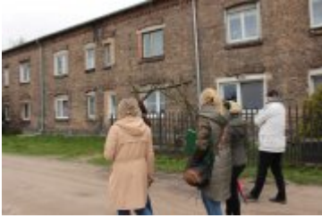
• Spacery badawcze