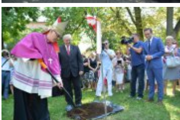
Diecezjalne obchody 1050. rocznicy chrztu Polski