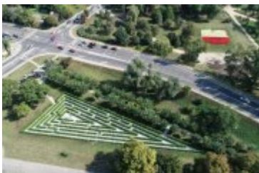
• Zielony labirynt, pomysł na ożywienie przestrzeni publicznej.