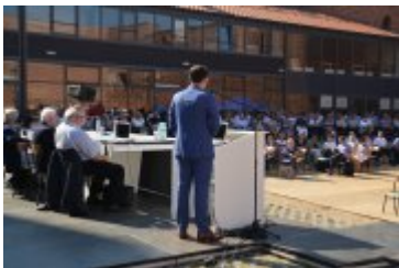
Ogólnopolska konferencja dotycząca ustawy krajobrazowej