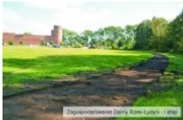
Zapoczątkowanie Dławy Rzeki Łutyszy - I etap