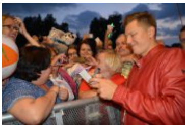
• Lato z Radiem