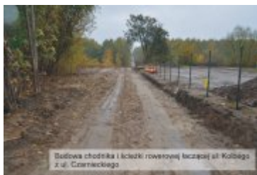
Bedowa chodnika i ławki rowerowej łączącej ul. Kolbąga z ul. Czarnieckiego