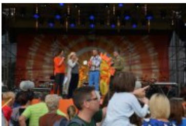
• Lato z Radiem