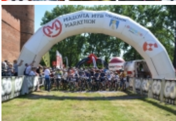
Mazovia MTB Marathon