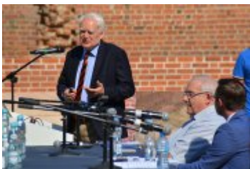
Ogólnopolska konferencja dotycząca ustawy krajobrazowej