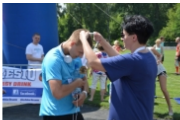
Bieg XXXVI Ciechanowska Piętnastka