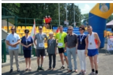
Bieg XXXVI Ciechanowska Piętnastka