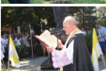
Diecezjalne obchody 1050. rocznicy chrztu Polski