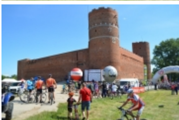
Mazovia MTB Marathon