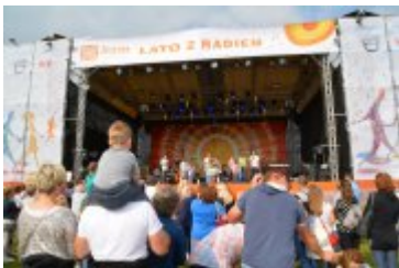
• Lato z Radiem