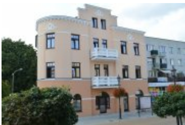
• Odnowiona zabytkowa kamienica przy ulicy Warszawskiej 18.