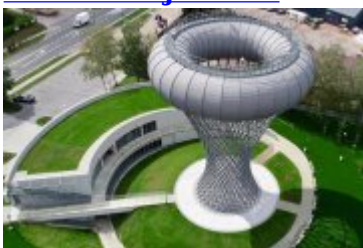
• Park Nauki Torus przy zrewitalizowanej wieży ciśnień.