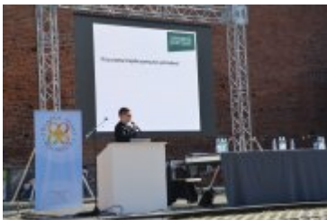
Ogólnopolska konferencja dotycząca ustawy krajobrazowej