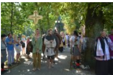
Diecezjalne obchody 1050. rocznicy chrztu Polski