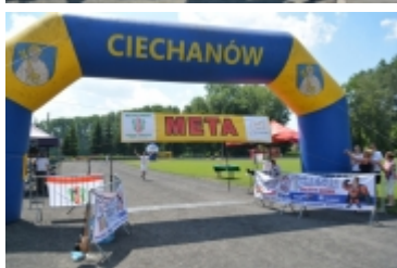
Bieg XXXVI Ciechanowska Piętnastka