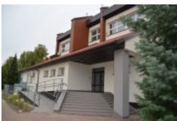
• Zmodernizowany budynek Ciechanowskiego Ośrodka Edukacji Kulturalnej Studio