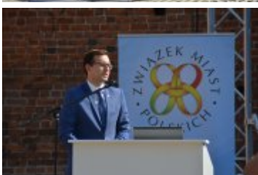
Ogólnopolska konferencja dotycząca ustawy krajobrazowej