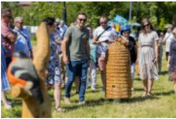
• Jubileuszowe Forum Miast Partnerskich