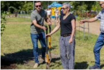
• Jubileuszowe Forum Miast Partnerskich