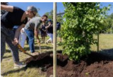
• Jubileuszowe Forum Miast Partnerskich