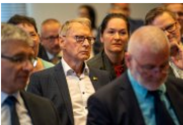
• Jubileuszowe Forum Miast Partnerskich