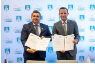
• Jubileuszowe Forum Miast Partnerskich