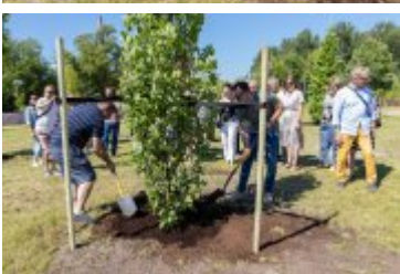
• Jubileuszowe Forum Miast Partnerskich