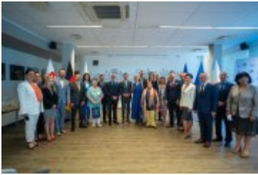
• Jubileuszowe Forum Miast Partnerskich