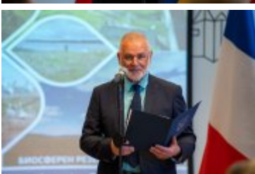
• Jubileuszowe Forum Miast Partnerskich