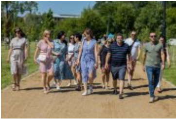
• Jubileuszowe Forum Miast Partnerskich