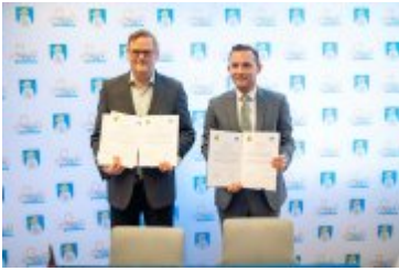
• Jubileuszowe Forum Miast Partnerskich