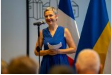
• Jubileuszowe Forum Miast Partnerskich