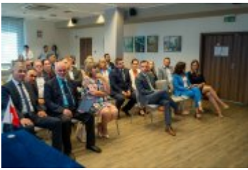
• Jubileuszowe Forum Miast Partnerskich