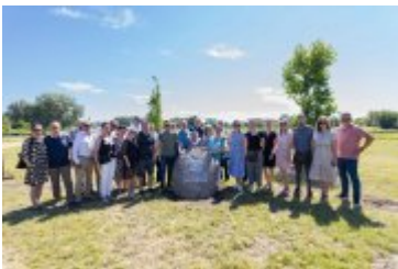
• Jubileuszowe Forum Miast Partnerskich