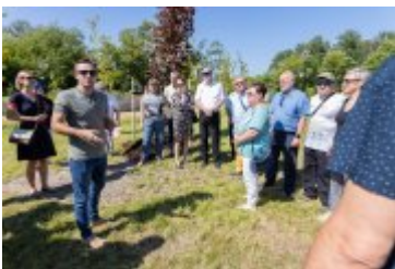
• Jubileuszowe Forum Miast Partnerskich