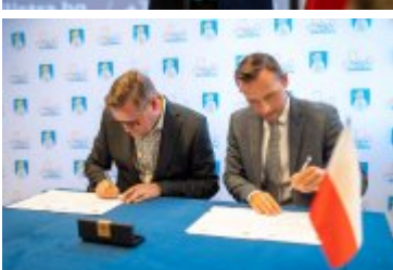
• Jubileuszowe Forum Miast Partnerskich