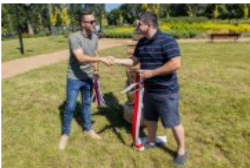
• Jubileuszowe Forum Miast Partnerskich