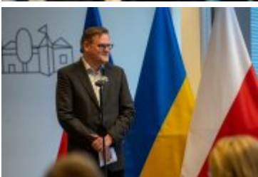
• Jubileuszowe Forum Miast Partnerskich