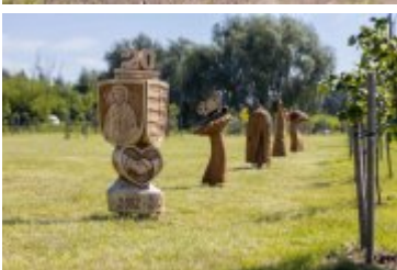
• Jubileuszowe Forum Miast Partnerskich