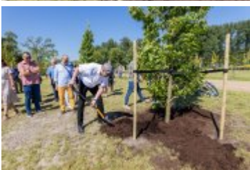
• Jubileuszowe Forum Miast Partnerskich