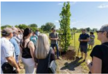
• Jubileuszowe Forum Miast Partnerskich