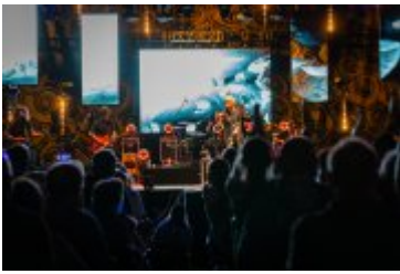
• Dni Miasta