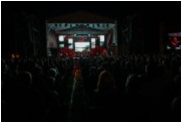
• Dni Miasta