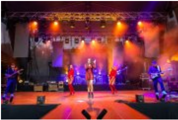
• Dni Miasta