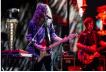
• Dni Miasta