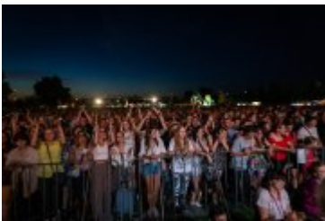
• Dni Miasta