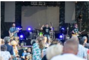
• Dni Miasta