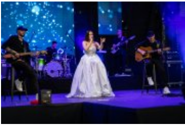
• Dni Miasta