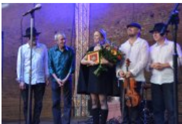
• Koncert Anny Marii Jopek i zespołu Kroke