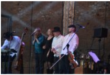
• Koncert Anny Marii Jopek i zespołu Kroke