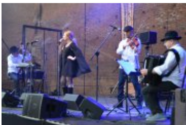
• Koncert Anny Marii Jopek i zespołu Kroke