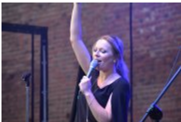
• Koncert Anny Marii Jopek i zespołu Kroke