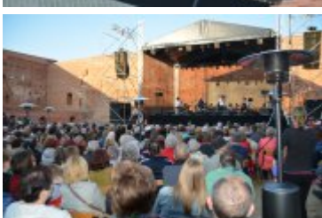
• Koncert Anny Marii Jopek i zespołu Kroke