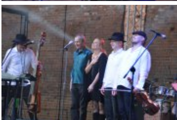
• Koncert Anny Marii Jopek i zespołu Kroke