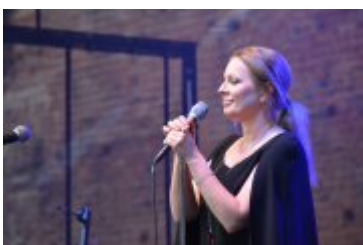
• Koncert Anny Marii Jopek i zespołu Kroke