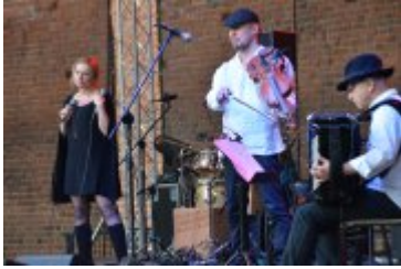
• Koncert Anny Marii Jopek i zespołu Kroke