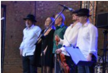
• Koncert Anny Marii Jopek i zespołu Kroke