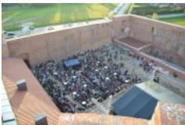
• Koncert Anny Marii Jopek i zespołu Kroke