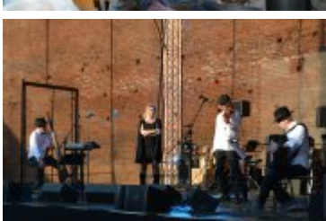
• Koncert Anny Marii Jopek i zespołu Kroke