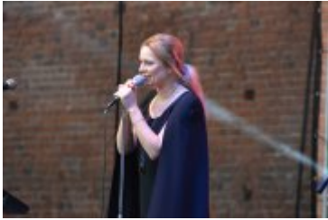
• Koncert Anny Marii Jopek i zespołu Kroke