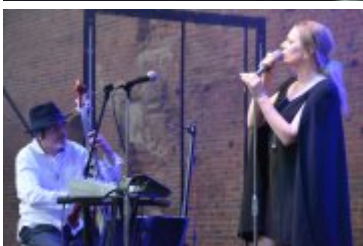
• Koncert Anny Marii Jopek i zespołu Kroke