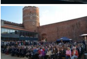
• Koncert Anny Marii Jopek i zespołu Kroke