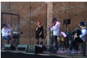
• Koncert Anny Marii Jopek i zespołu Kroke