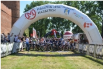
Mazovia MTB Marathon