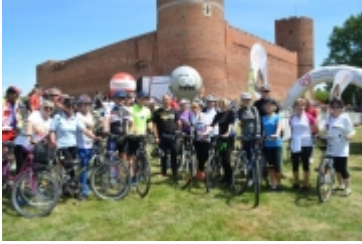
Mazovia MTB Marathon