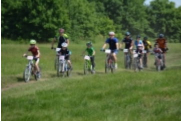
Mazovia MTB Marathon