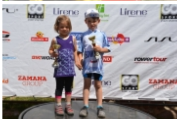
Mazovia MTB Marathon