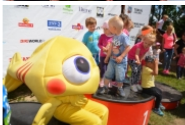
Mazovia MTB Marathon