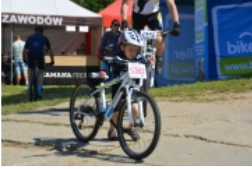
Mazovia MTB Marathon