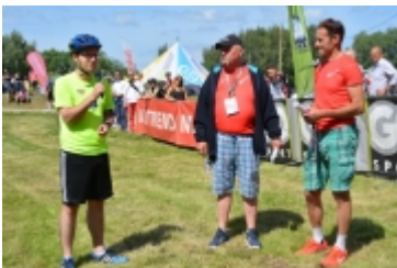
Mazovia MTB Marathon