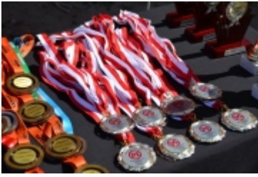
Mazovia MTB Marathon