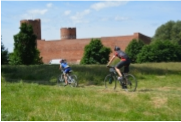
Mazovia MTB Marathon