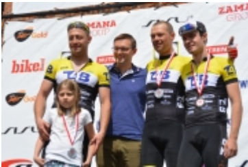
Mazovia MTB Marathon