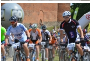
Mazovia MTB Marathon