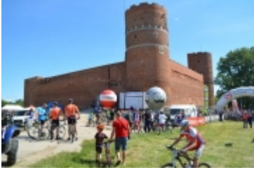
Mazovia MTB Marathon