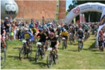
Mazovia MTB Marathon