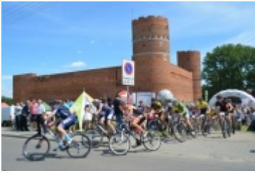
Mazovia MTB Marathon