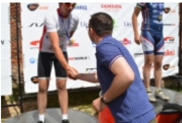
Mazovia MTB Marathon