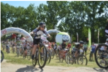
Mazovia MTB Marathon