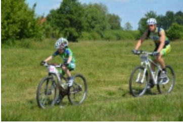
Mazovia MTB Marathon