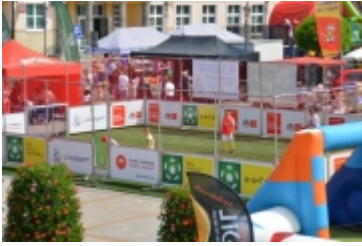
Motoserce - 28.05.2016