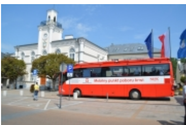
Motoserce - 28.05.2016