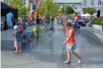
Motoserce - 28.05.2016