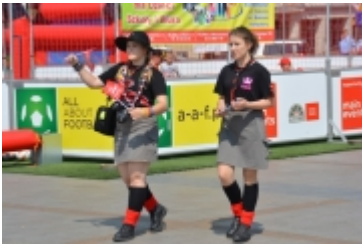
Motoserce - 28.05.2016