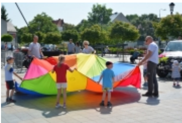
Motoserce - 28.05.2016