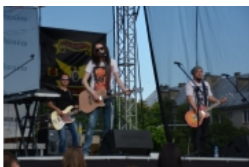
Motoserce - 28.05.2016