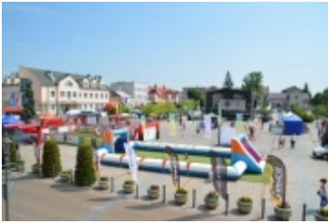
Motoserce - 28.05.2016