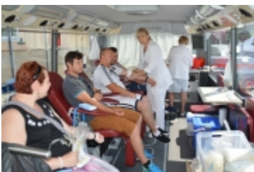
Motoserce - 28.05.2016