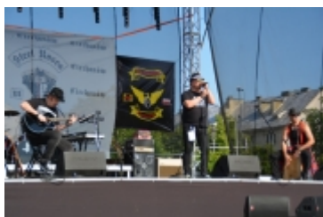
Motoserce - 28.05.2016