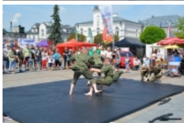
Motoserce - 28.05.2016