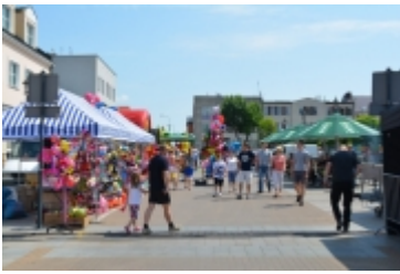
Motoserce - 28.05.2016