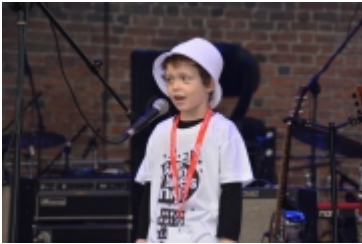
• 19. Spring Blues Night i Noc Muzeów