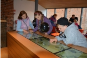
• 19. Spring Blues Night i Noc Muzeów