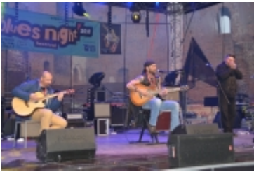
• 19. Spring Blues Night i Noc Muzeów