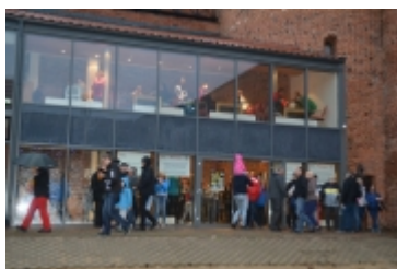
• 19. Spring Blues Night i Noc Muzeów