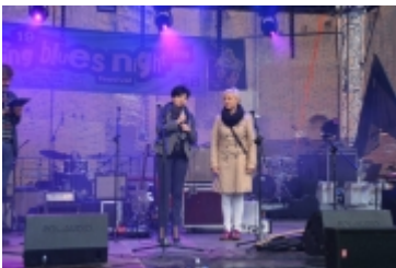
• 19. Spring Blues Night i Noc Muzeów