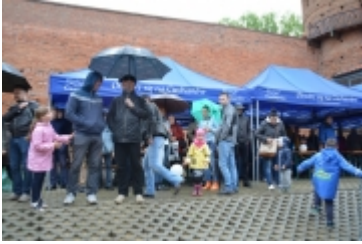
• 19. Spring Blues Night i Noc Muzeów