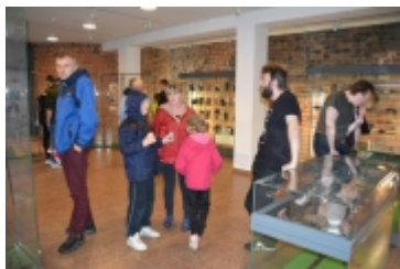
• 19. Spring Blues Night i Noc Muzeów