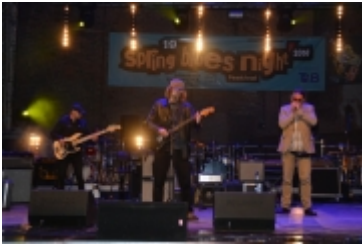
• 19. Spring Blues Night i Noc Muzeów