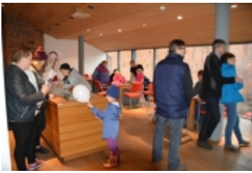
• 19. Spring Blues Night i Noc Muzeów