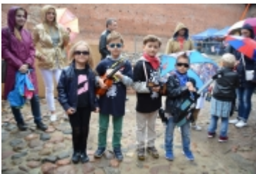
• 19. Spring Blues Night i Noc Muzeów