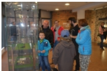
• 19. Spring Blues Night i Noc Muzeów