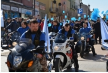
• Dzień Świadomości Autyzmu