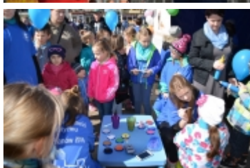
Dzień Świadomości Autyzmu