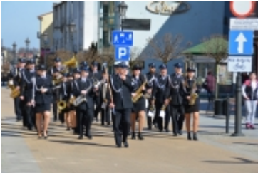
• Dzień Świadomości Autyzmu