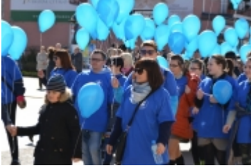
• Dzień Świadomości Autyzmu