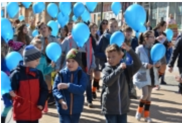
Dzień Świadomości Autyzmu