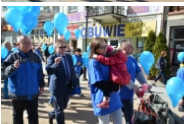
Dzień Świadomości Autyzmu