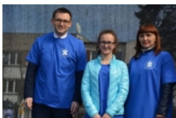
Dzień Świadomości Autyzmu