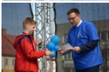
Dzień Świadomości Autyzmu