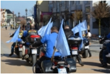
• Dzień Świadomości Autyzmu