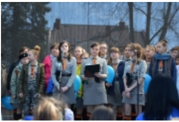
• Dzień Świadomości Autyzmu