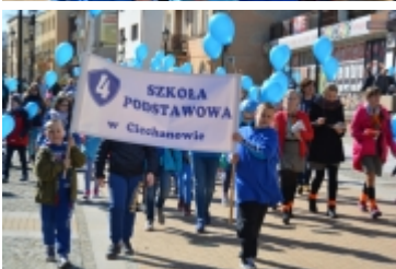
Dzień Świadomości Autyzmu