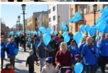
Dzień Świadomości Autyzmu