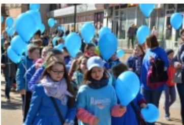
Dzień Świadomości Autyzmu