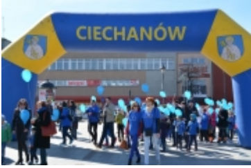
Dzień Świadomości Autyzmu