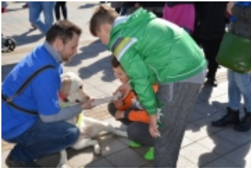
• Dzień Świadomości Autyzmu