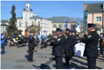
Dzień Świadomości Autyzmu