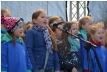
• Dzień Świadomości Autyzmu