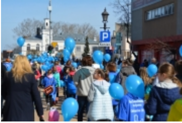
Dzień Świadomości Autyzmu