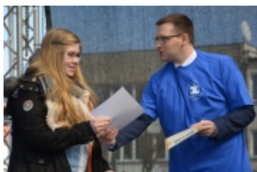
Dzień Świadomości Autyzmu