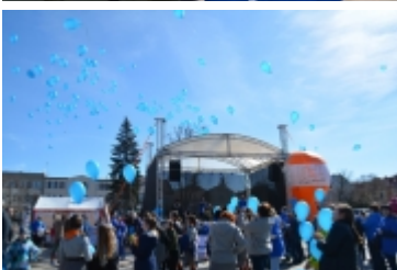
• Dzień Świadomości Autyzmu