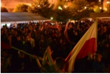
• Strefa kibica