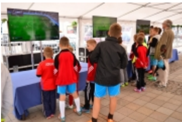
• Strefa kibica