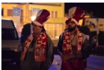
• Strefa kibica