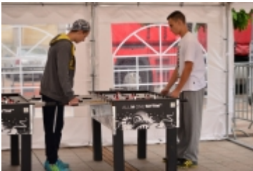
• Strefa kibica