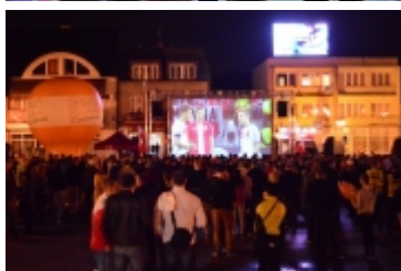
• Strefa kibica