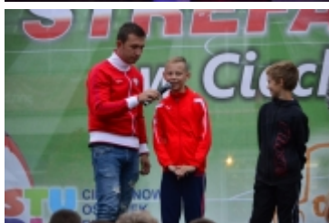
• Strefa kibica