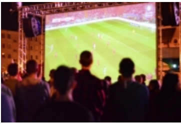
• Strefa kibica