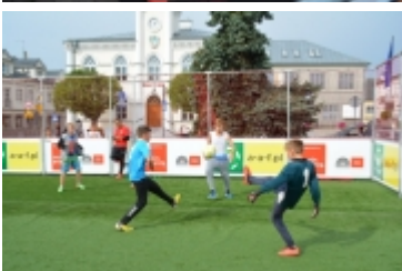
• Strefa kibica