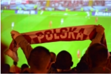
• Strefa kibica