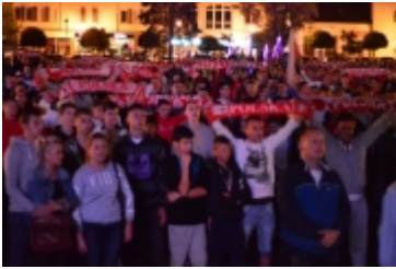
• Strefa kibica