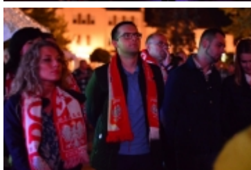
• Strefa kibica