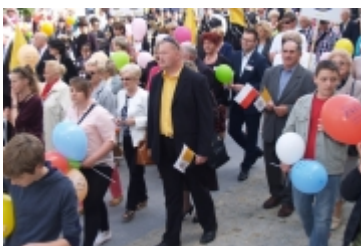
• Ciechanowski Marsz dla Życia i Rodziny