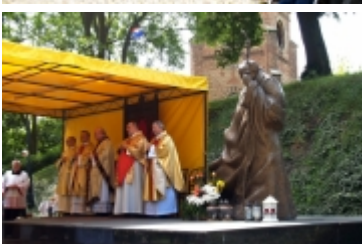
Ciechanowski Marsz dla Życia i Rodziny