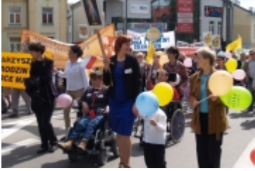
Ciechanowski Marsz dla Życia i Rodziny