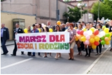
Ciechanowski Marsz dla Życia i Rodziny