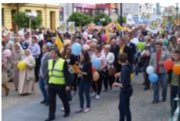
• Ciechanowski Marsz dla Życia i Rodziny