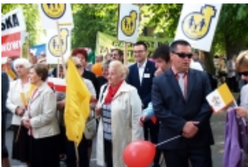
Ciechanowski Marsz dla Życia i Rodziny