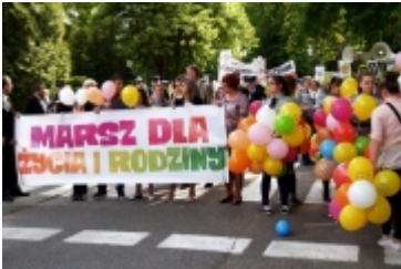
Ciechanowski Marsz dla Życia i Rodziny