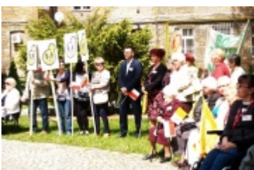
Ciechanowski Marsz dla Życia i Rodziny