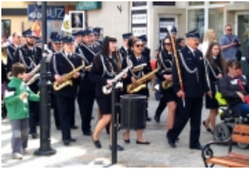
Ciechanowski Marsz dla Życia i Rodziny