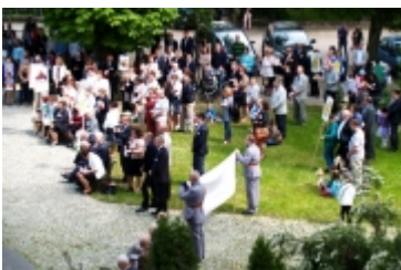
Ciechanowski Marsz dla Życia i Rodziny