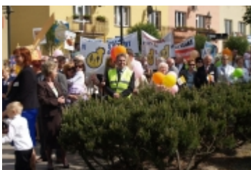
• Ciechanowski Marsz dla Życia i Rodziny