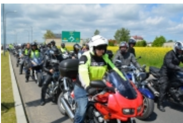
I Rodzinny Festiwal Sportowy