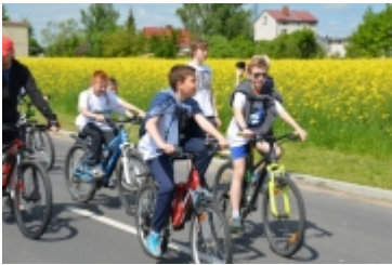
I Rodzinny Festiwal Sportowy