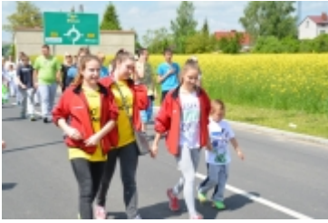
I Rodzinny Festiwal Sportowy