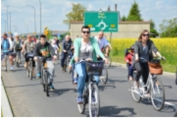
I Rodzinny Festiwal Sportowy