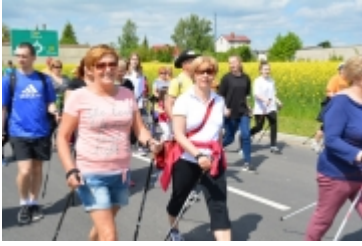
I Rodzinny Festiwal Sportowy