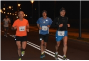
• I Rodzinny Festiwal Sportowy