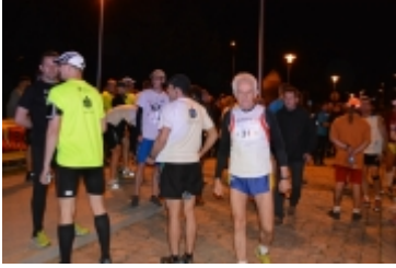
• I Rodzinny Festiwal Sportowy