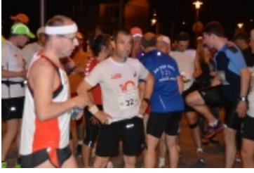
• I Rodzinny Festiwal Sportowy