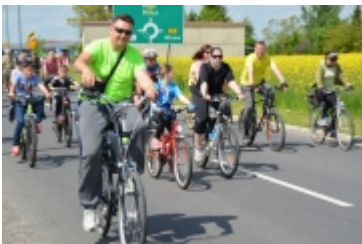
I Rodzinny Festiwal Sportowy