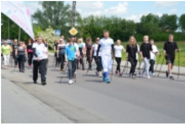
I Rodzinny Festiwal Sportowy