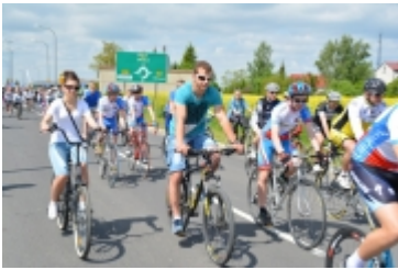
I Rodzinny Festiwal Sportowy