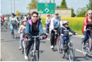
I Rodzinny Festiwal Sportowy