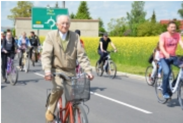
I Rodzinny Festiwal Sportowy