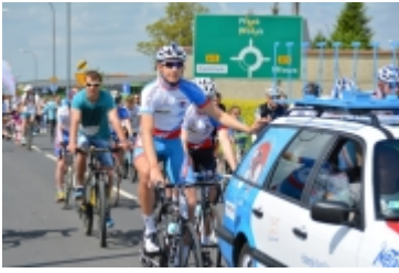
I Rodzinny Festiwal Sportowy