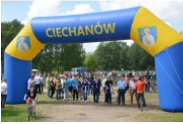
I Rodzinny Festiwal Sportowy