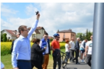
I Rodzinny Festiwal Sportowy