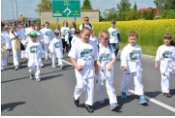
I Rodzinny Festiwal Sportowy