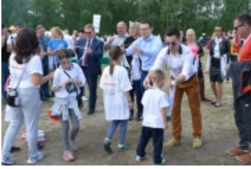
I Rodzinny Festiwal Sportowy