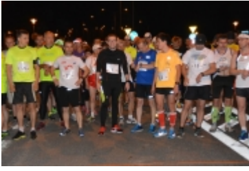
• I Rodzinny Festiwal Sportowy