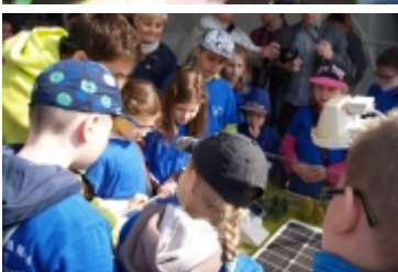
• Miasteczko edukacyjne