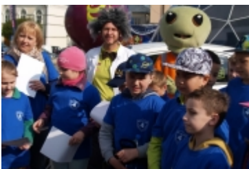
• Miasteczko edukacyjne