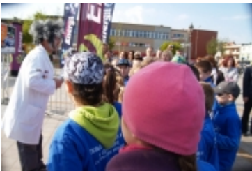
• Miasteczko edukacyjne