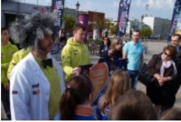
• Miasteczko edukacyjne