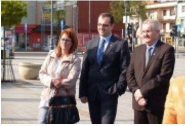
• Miasteczko edukacyjne