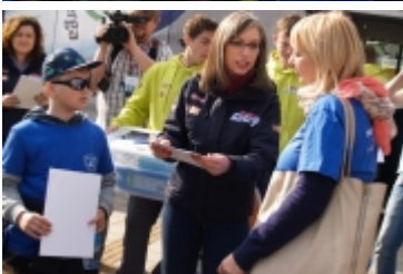
• Miasteczko edukacyjne