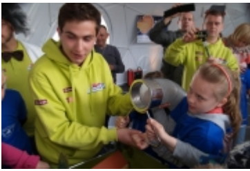
• Miasteczko edukacyjne