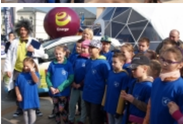
• Miasteczko edukacyjne