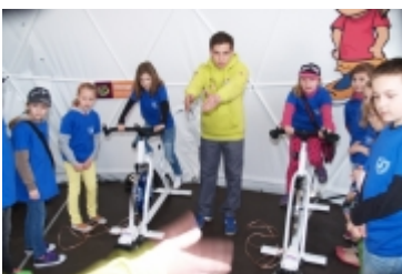
• Miasteczko edukacyjne