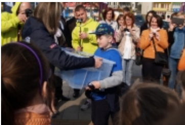
• Miasteczko edukacyjne