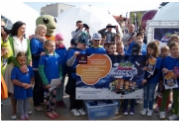
• Miasteczko edukacyjne