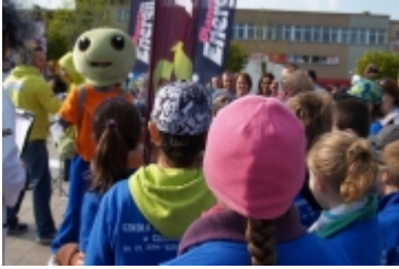
• Miasteczko edukacyjne