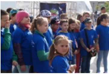
• Miasteczko edukacyjne