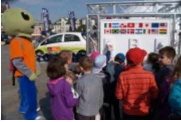
• Miasteczko edukacyjne