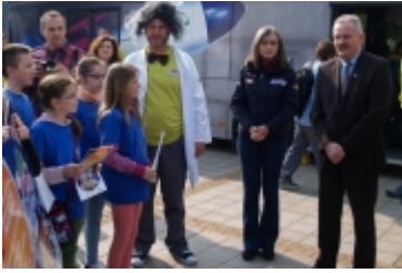
• Miasteczko edukacyjne