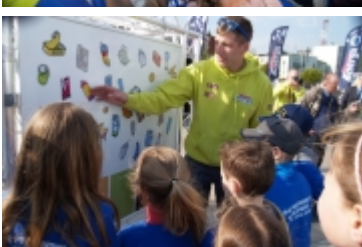
• Miasteczko edukacyjne