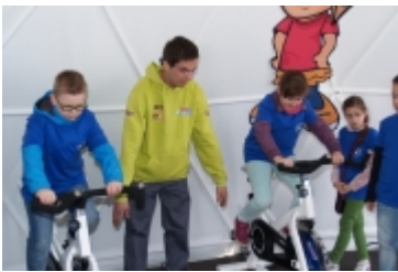
• Miasteczko edukacyjne