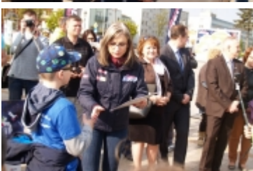
• Miasteczko edukacyjne