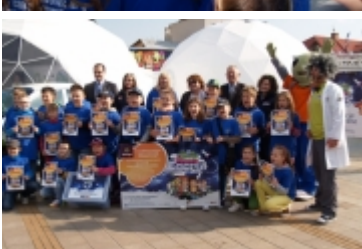
• Miasteczko edukacyjne