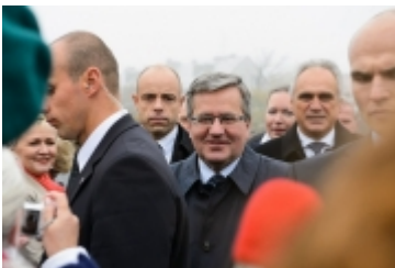
• Prezydent RP w Ciechanowie