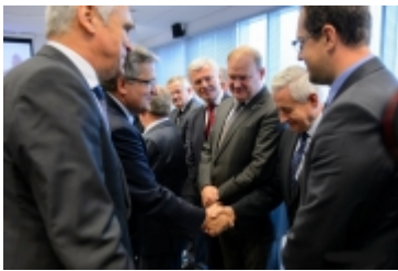
• Prezydent RP w Ciechanowie