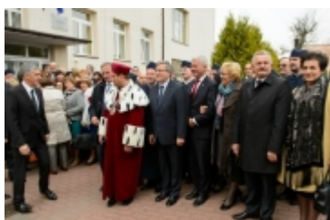
• Prezydent RP w Ciechanowie