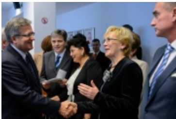
• Prezydent RP w Ciechanowie