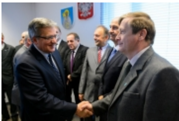
• Prezydent RP w Ciechanowie