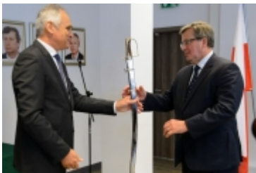
• Prezydent RP w Ciechanowie