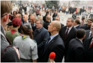
• Prezydent RP w Ciechanowie