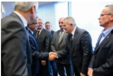
• Prezydent RP w Ciechanowie