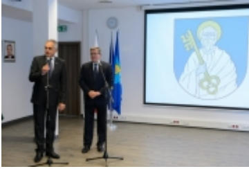
• Prezydent RP w Ciechanowie