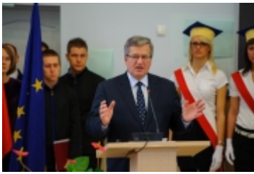
• Prezydent RP w Ciechanowie