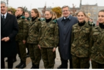
• Prezydent RP w Ciechanowie