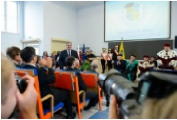
• Prezydent RP w Ciechanowie