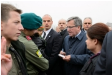
• Prezydent RP w Ciechanowie