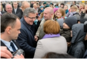
• Prezydent RP w Ciechanowie