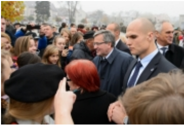
• Prezydent RP w Ciechanowie