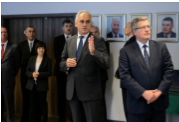
• Prezydent RP w Ciechanowie