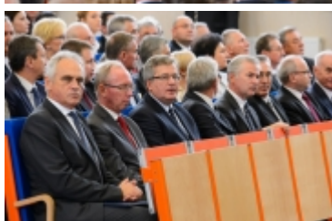
• Prezydent RP w Ciechanowie