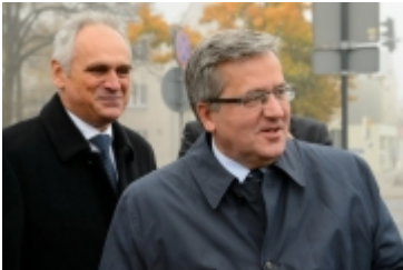
• Prezydent RP w Ciechanowie