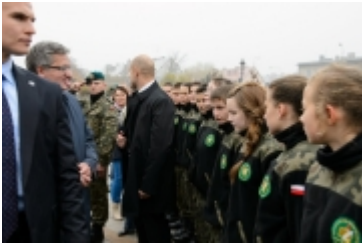
• Prezydent RP w Ciechanowie