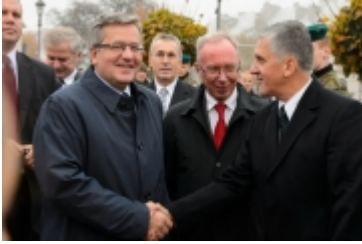
• Prezydent RP w Ciechanowie