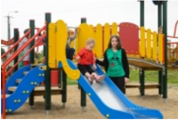
Dzień Dziecka na placu zabaw przy ul. Kraszewskiego