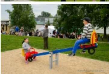
Dzień Dziecka na placu zabaw przy ul. Kraszewskiego