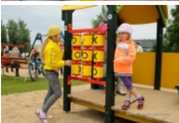
Dzień Dziecka na placu zabaw przy ul. Kraszewskiego