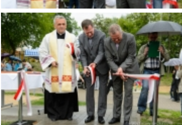
Dzień Dziecka na placu zabaw przy ul. Kraszewskiego