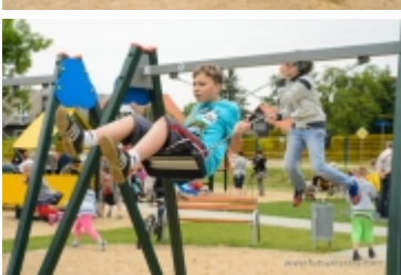
Dzień Dziecka na placu zabaw przy ul. Kraszewskiego