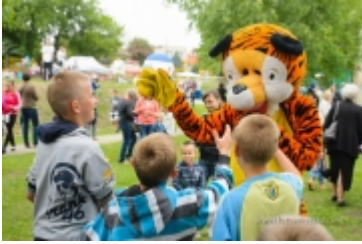
Dzień Dziecka na placu zabaw przy ul. Kraszewskiego