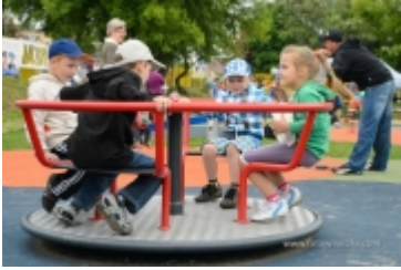
Dzień Dziecka na placu zabaw przy ul. Kraszewskiego