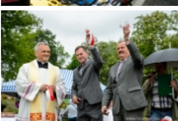
Dzień Dziecka na placu zabaw przy ul. Kraszewskiego