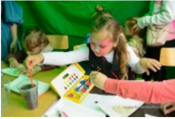
Dzień Dziecka na placu zabaw przy ul. Kraszewskiego