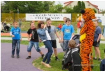
Dzień Dziecka na placu zabaw przy ul. Kraszewskiego