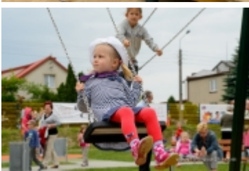
Dzień Dziecka na placu zabaw przy ul. Kraszewskiego