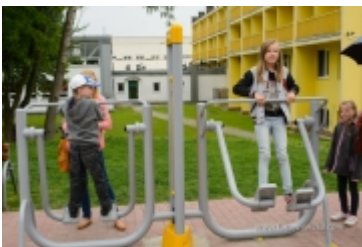
Dzień Dziecka na placu zabaw przy ul. Kraszewskiego