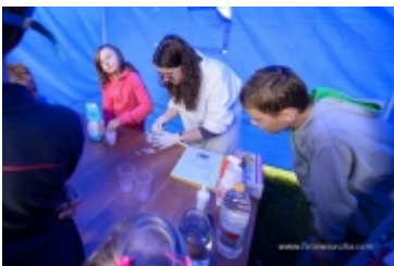
Dzień Dziecka na placu zabaw przy ul. Kraszewskiego