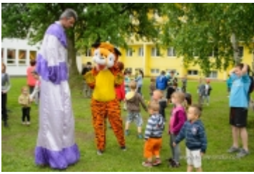
Dzień Dziecka na placu zabaw przy ul. Kraszewskiego