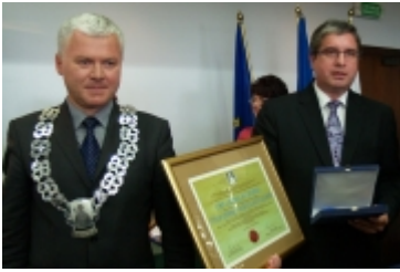
Forum Miast Partnerskich