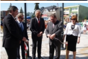
Forum Miast Partnerskich