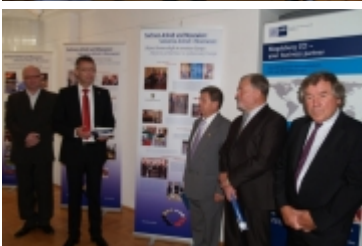
Forum Miast Partnerskich