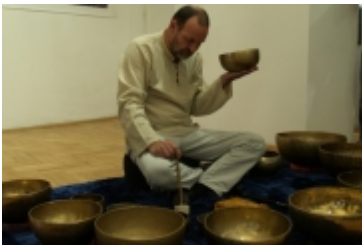
Forum Miast Partnerskich