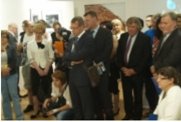
Forum Miast Partnerskich