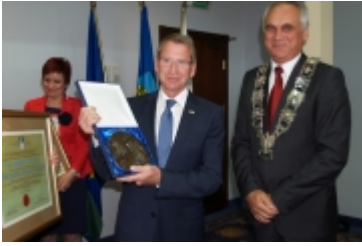
Forum Miast Partnerskich