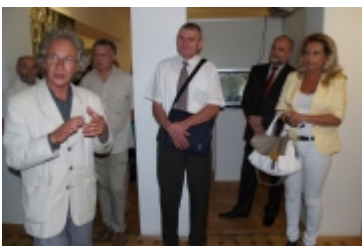
Forum Miast Partnerskich