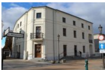
• Powiatowa Biblioteka Publiczna