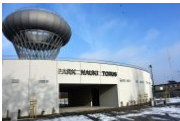
• Park Nauki Torus