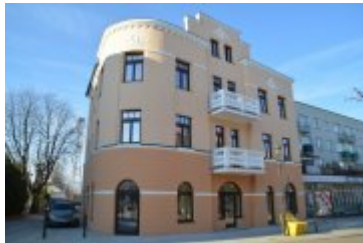
• Kamienica Warszawska 18