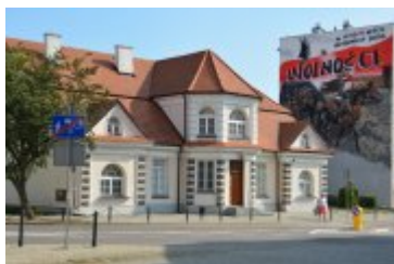
Budynek Ekspozycyjny w Ciechanowie