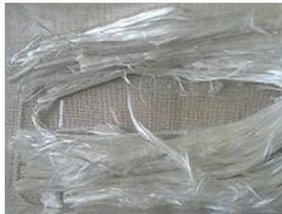
Włókna azbestu 1

Azbest był wykorzystywany jako bardzo dobry surowiec do czasu udowodnienia jego szkodliwego oddziaływania na zdrowie ludzi, tj. do połowy lat 80-tych ubiegłego stulecia. Dowiedziano wówczas, że włókna azbestu (o grubości mniejszej niż 3,0 i długości powyżej 5,0 mikrometrów) przedostające się do organizmu człowieka z wdychanym powietrzem są rakotwórcze.