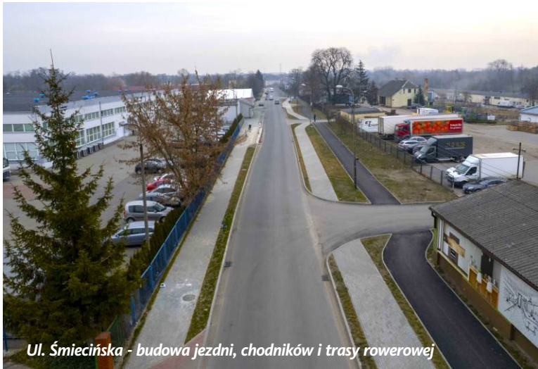
Ul. Śmiecińska - budowa jezdni, chodników i trasy rowerowej

W planach miasta znalazły się również: modernizacja ul. Fabrycznej wraz z budową ścieżki rowerowej (przez Dworzec Przemysłowy aż do Ronda Solidarności), budowa nowego mostu w ul. Augustiańskiej, powstanie chodnika w ul. Szczurzynek oraz opracowanie dokumentacji technicznych dla dwunastu ulic. Remont siedmiu z nich (ulic: Mazowieckiego, Wołodyjowskiego, Pogodnej, Pięknego, Złotej, Szmaragdowej, Błękitnej, Wiejskiej, Rybnej, Komunalnej, Leśmiana, Dą-