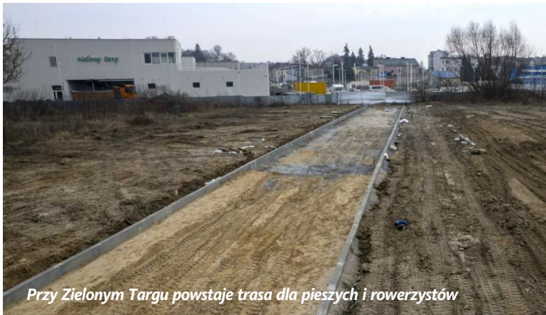
Przy Zielonym Targu powstaje trasa dla pieszych i rowerzystów