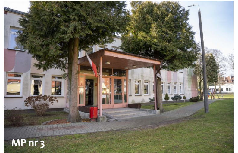
MP nr 3

Przedszkole z oddziałami integracyjnymi, zlokalizowane w Śródmieściu,