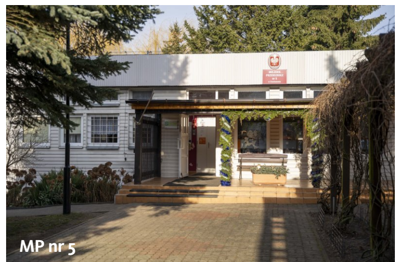
MP nr 5

nieopodal parku i rzeki Łydyni. Oferuje zintegrowane programy oddziaływań wychowawczych i dydaktycznych, metodami sprzyjającymi wszechstronnemu rozwojowi dziecka.