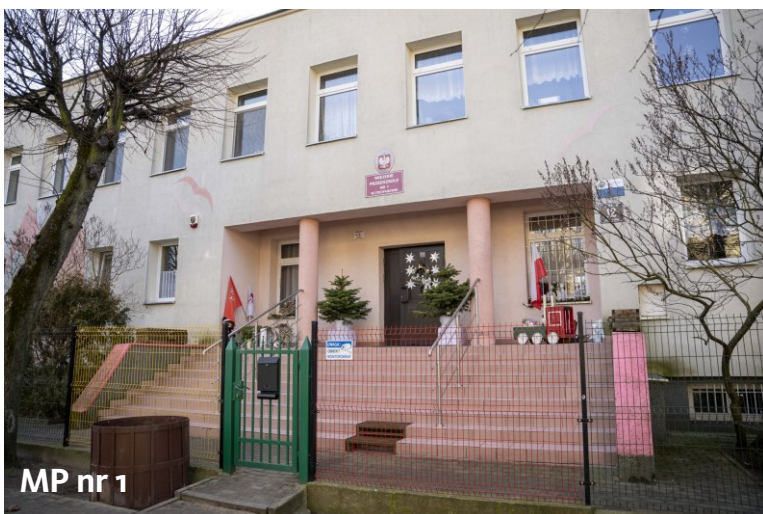
MP nr 1