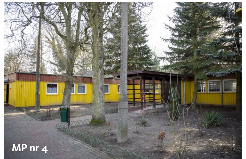
MP nr 4