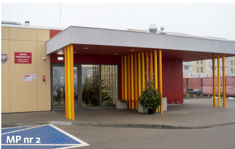
MP nr 2