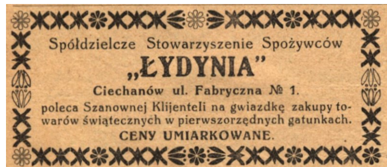
Kronika Ciechanowska, rok II, nr 19 i 20, 1931 r.