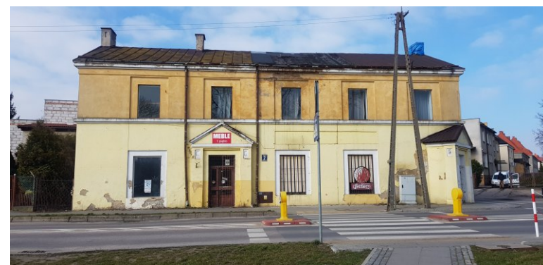
Budynek przy ul. Fabrycznej 2, 2020 r. – przed remontem.

Budynek jest wpisany do Gminnej Ewidencji Zabytków Miasta Ciechanów, Rejestru Zabytków Nieruchomych Województwa Mazowieckiego oraz znajduje się w strefie ochrony konserwatorskiej i strefie obserwacji archeologicznej. Podstawą objęcia ochroną budynku dawnego Stowarzyszenia Spożywczego „Łydynia” jest jego wartość historyczna związana z datą powstania, miejscem, wybitnymi osobistościami oraz wydarzeniami istotnymi w skali miasta, jak i regionu Mazowsza Północnego. Nazwa Stowarzyszenia ma kontekst lokalny – nawiązuje do płynącej obok jego siedziby rzeki Łydyni.