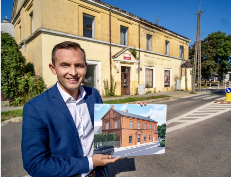
Prezydent Ciechanowa Krzysztof Kosiński podczas prezentacji koncepcji odnowienia zabytkowego budynku przy ul. Fabrycznej 2.

Budynek jest wpisany zarówno w tło historyczne, jak i kulturalne dziedzictwo Ciechanowa.