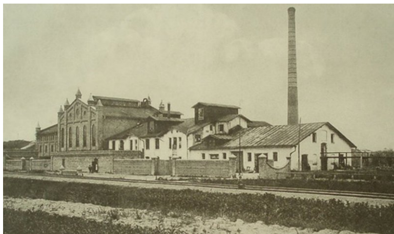
Cukrownia w Ciechanowie, 1902 r.