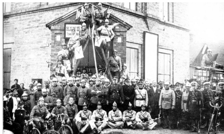
Strażacy z ciechanowskiej OSP przed budynkiem „Łydyni”, początek XX wieku.

W uroczystym otwarciu Spółdzielni w 1907 r. wziął udział pionier polskiej spółdzielczości, Stanisław Wojciechowski, Prezydent Rzeczypospolitej Polskiej w latach 1922-1926. Zgodnie z wolą