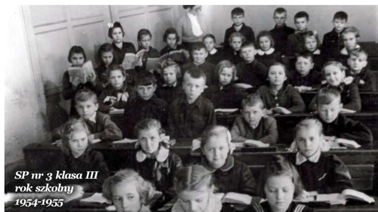
SP nr 3 klasa III rok szkolny 1954-1955