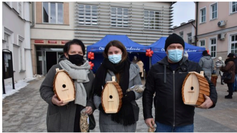
Ciechanowski ratusz rozdał mieszkańcom 500 budek lęgowych oraz porcje karmy dla ptaków. Można je było odebrać w dniu święta zakochanych przed budynkiem Urzędu Miasta.

Mieszkańcy Ciechanowa otrzymali bezpłatne drewniane budki, w których już wiosną mogą wykluć się pisklęta. Dla każdego miłośnika ekologii przygotowana była też porcja karmy do dokarmiania ptaków zimą. Budki lęgowe były rozdawane na świeżym powietrzu. Nastrój święta zakochanych podkreśliło też 3 metrowe czerwone serce, w którym można było wykonać pamiątkowe zdjęcie.