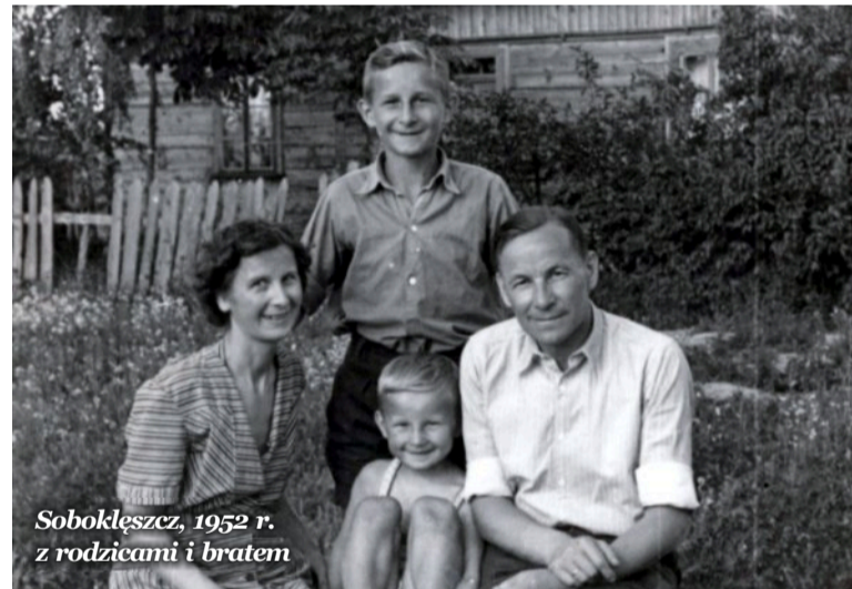
Sobokleszcz, 1952 r. z rodzicami i bratem